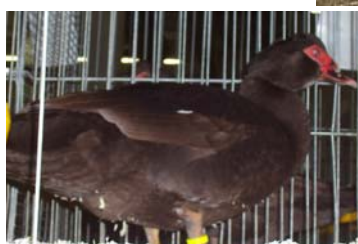
Bild links: Warzenerpel in braun-wildfarbig. Angestrebt wird ein sattes Braun mit kupferartigem Glanz.

Bild rechts: Zwei junge wildfarbige Vertreter. Wenn gewohnt schwimmen die Warzenenten gerne.