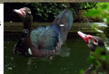
Bild rechts: Zwei junge wildfarbige Vertreter. Wenn gewohnt schwimmen die Warzenenten gerne.

Bild links: Warzenerpel in braun-wildfarbig. Angestrebt wird ein sattes Braun mit kupferartigem Glanz.