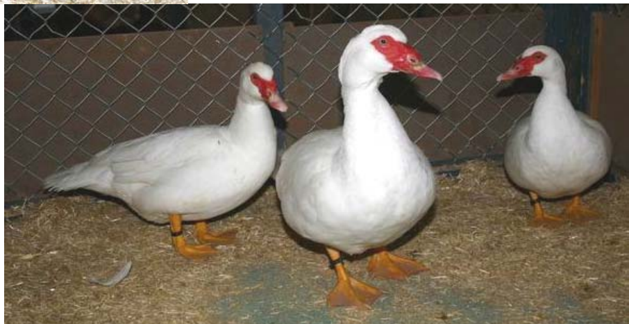
Bild rechts: Stamm weißer Warzenenten. Hier werden höchste Ansprüche an Gefieder und die gelben Läufe gestellt.

Bild oben: Prima gezeichnete Ente der Schwarz-gescheckten. Diese Variante gibt es auch in Braun und Blau.