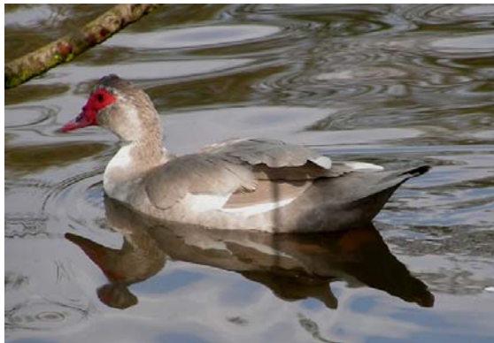
Bild links: Im Wasser fühlt man sich wohl, ein Perlgrau-wildfarbiger Erpel.

Bild rechts: Studie eines bereits in die Jahre gekommen Erpels der Wildfarbigen mit Latz. Bei Jungtieren ist die Kopffarbe schwarz ohne weiß.